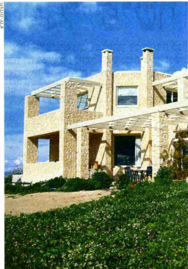
בית ירוק מאבן באי אגינה ביוון, של האדריכל איליאס מסינס

שעליה חתמו 15 ראשי הרשויות המקומיות הגדולות בישראל. "מרבית היוזמים לא יבנו יותר בניינים ללא תקן ירוק", טוענת רגני. "הביקוש לבנייה ירוקה יגיע הז' מכיוון רוכשי הדירות והן מכיוונם של גורמי התכנון, וברא" שם הרשויות המקומיות. כבר כיום אפשר לראות בעולם שבתים ירר קים זוכים לעדיפות בעיני הקונים בעת תהליך הרכישה. החיסכון באנרגיה יביא גם לחיסכון כספי, שישתלם לכל הצדדים."